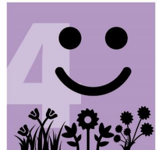
Mehr Vielfalt: ein Grund zur Freude