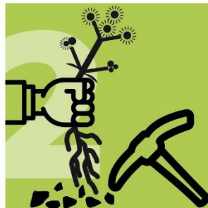
Das Berufkraut erfolgreich entfernen